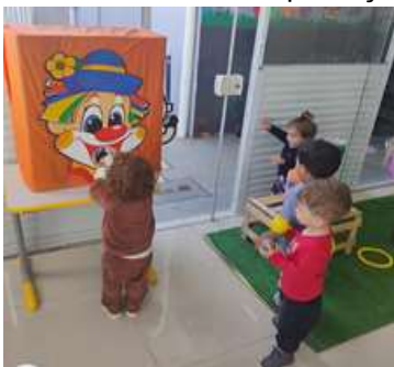
Atividade 1: Estimulando movimentos amplos- acerte a boca do palhaço