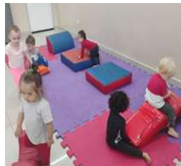
Atividade 7: Circuito com obstáculos