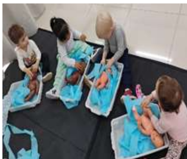
Atividade 6: Simulando banho em bonecas