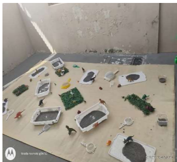
Atividade 1: Desenvolvimento sensorial com chia