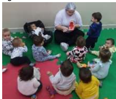
Atividade 7: Incentivando uma boa higiene bucal