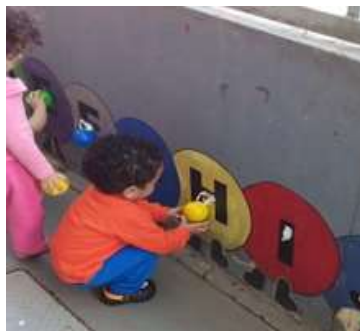
Atividade 6: Resgatar a bolinha