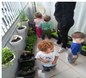
Atividade 2: Projeto horta: Acompanhando crescimento das hortaliça