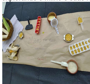
Atividade 3: Espaço organizado, explorando o milho e suas formas