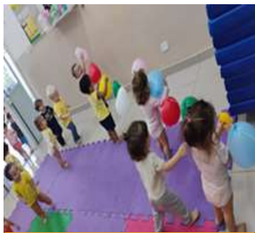
Atividade 5: Varal com bexigas coloridas