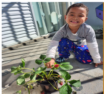
Atividade 1: Projeto horta: Colheita de morango