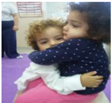
Atividade 4: Expressar