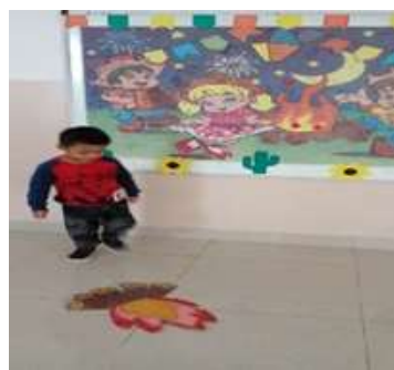
Atividade 3: Pula fogueira