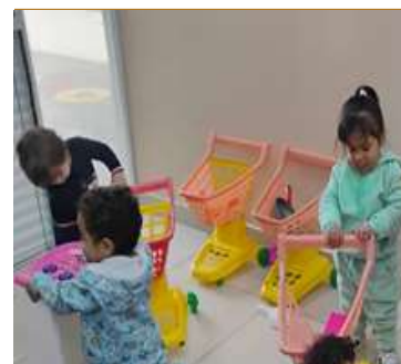
Atividade 3: Projeto Cozinha saudável: Faz de conta mercadinho saudável