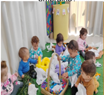
Atividade 1: O que tem embaixo do embrulho?