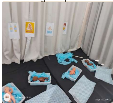
Atividade 2: Cuidado com bebê, estilando higiene pessoal