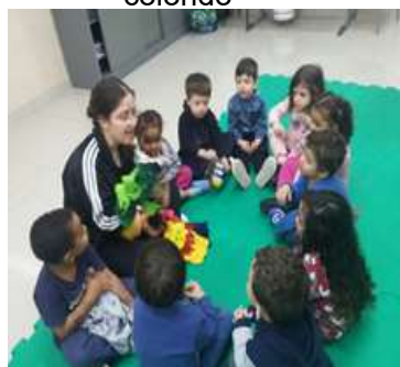
Atividade 6: Brincadeira do retalho colorido