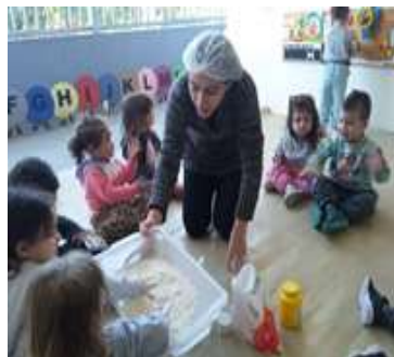
Atividade 2: Confeção de massinha