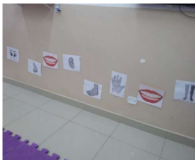
Atividade 5: Explorando os sentidos