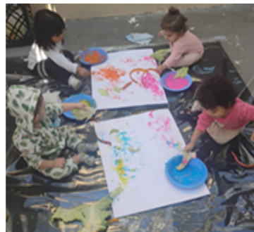
Atividade 3: Pintura livre com tinta