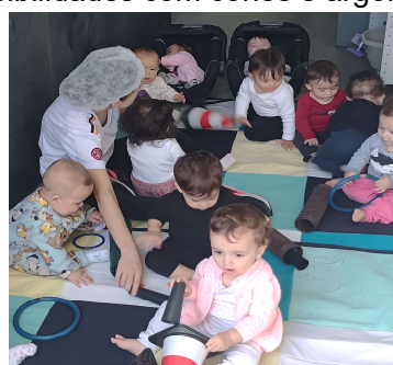
Atividade 7: Explorando possibilidades com cones e argolas